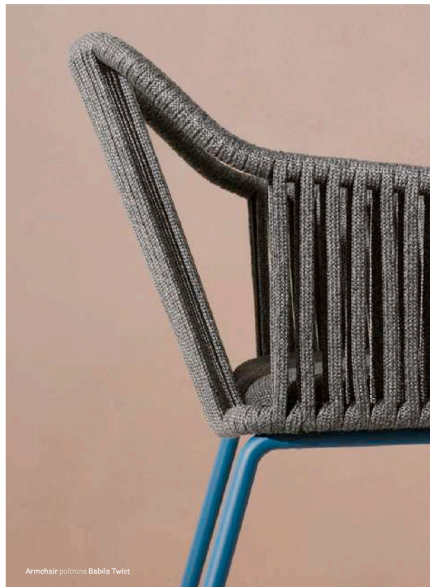
Armchair poltrona Babila Twist