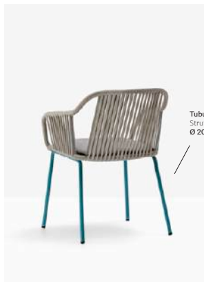
Tubular steel frame Struttura in tubo d'acciaio Ø 20 mm