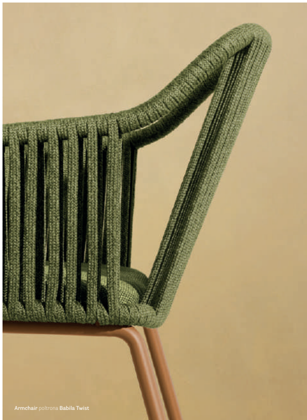
Armchair poltrona Babila Twist