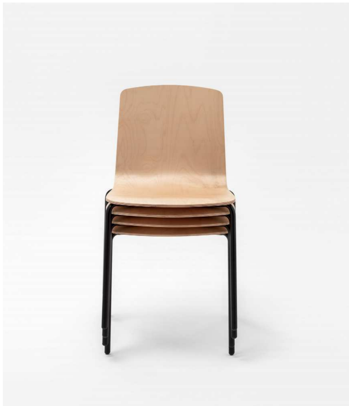
S3000F chairs with birch shell and black powder coated frame stacked.