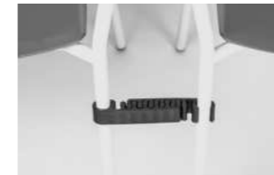
alignments links agganci allineamento