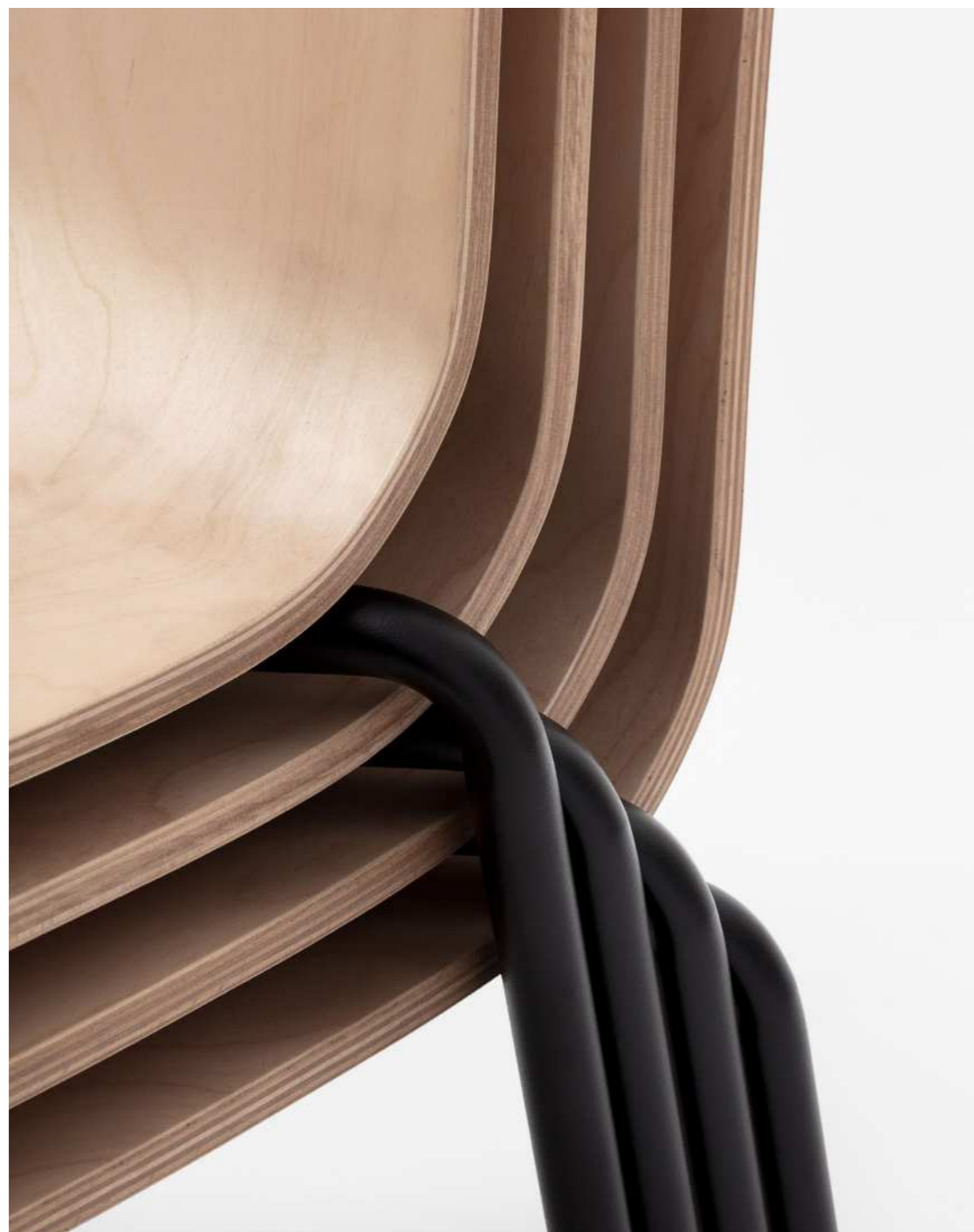
Detail of the S3000F wood shell.