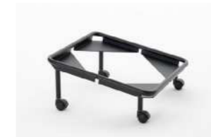
trolley (max 10 pcs) carrello