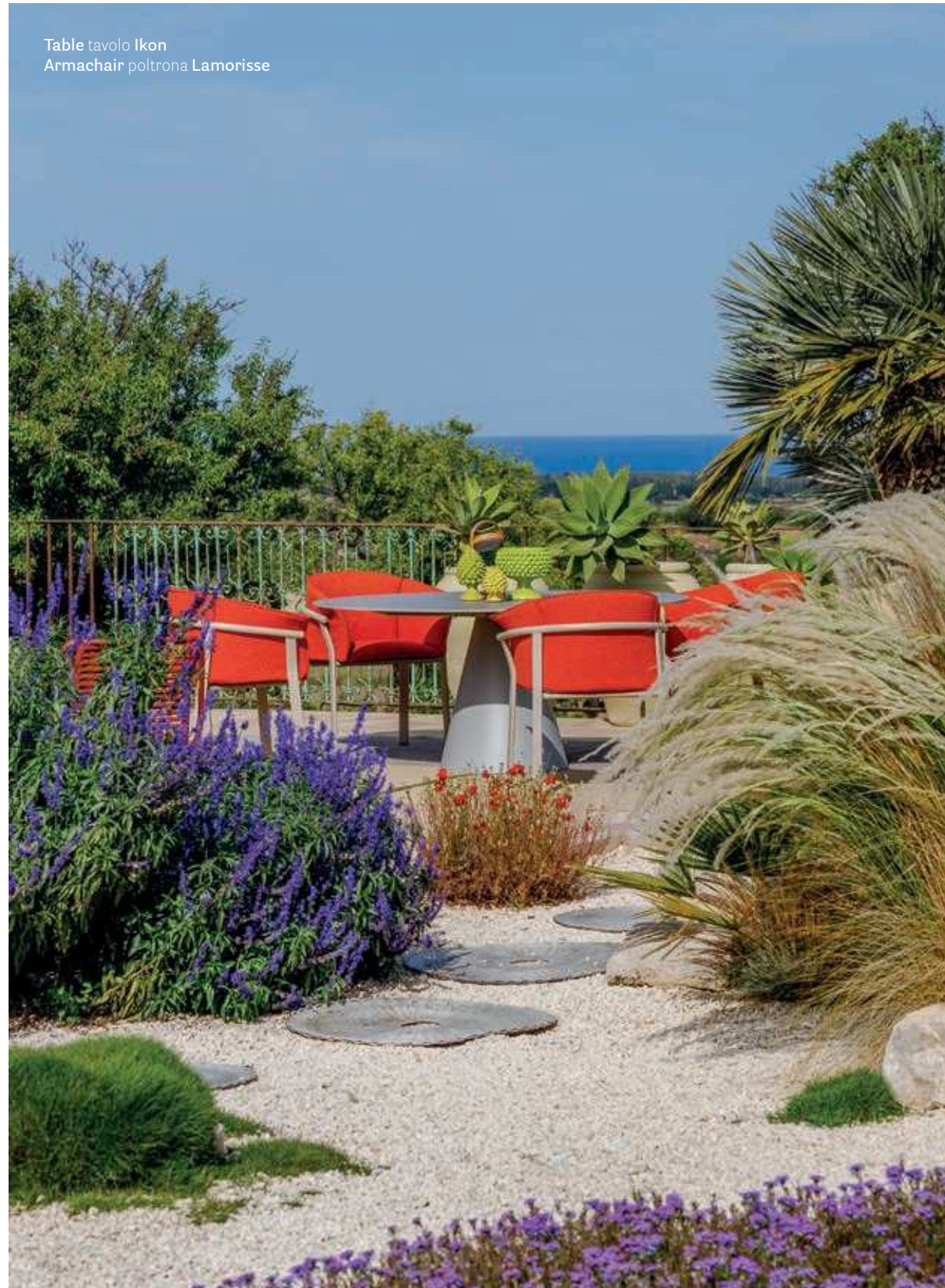
Table tavolo Ikon Armchair poltrona Lamorisse