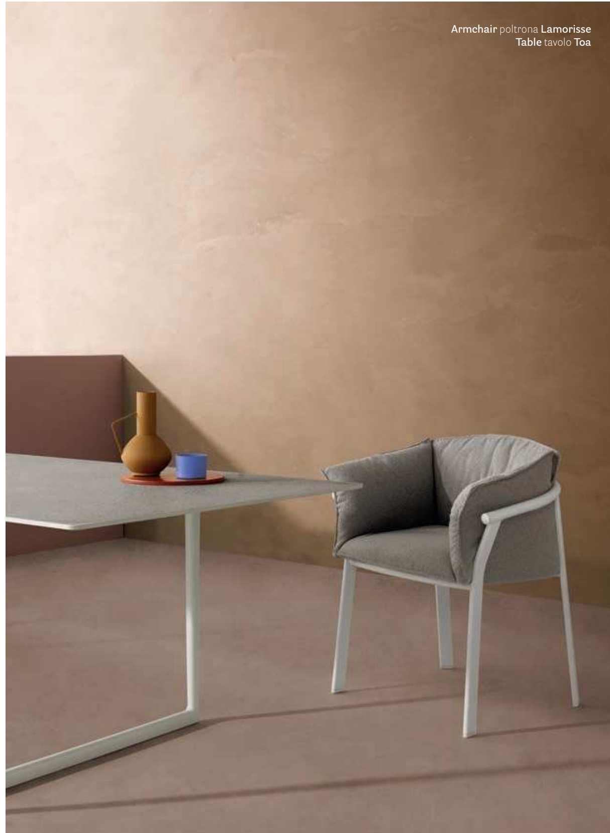
Armchair poltrona Lamorisse Table tavolo Toa