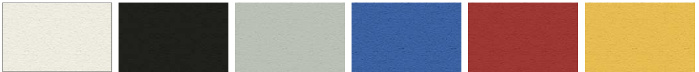
LM01 Bianco - White