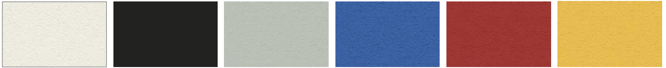
Bianco - White RAL9003