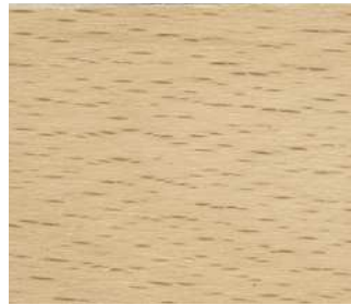
Faggio naturale Natural beech