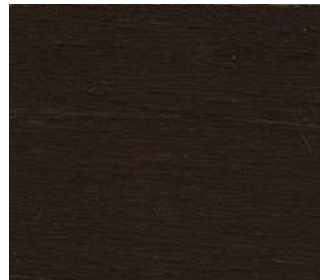
Faggio wengé Wenge-stain beech