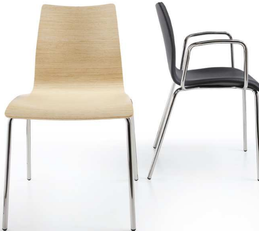
S290L E P290T