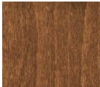
Faggio tinto noce biondo PC3-023 Blondie walnut stained beech PC3-023