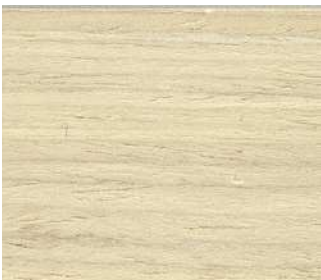
Rovere sbiancato Whitened oak