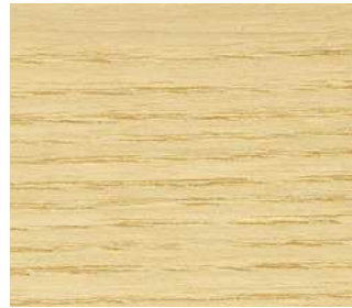
Frassino naturale (disponibile solo per sedia Charlotte) Natural ash (available only for Charlotte chair)