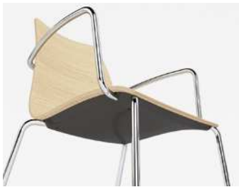
Sottosedile in plastica Plastic underseat