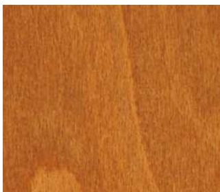
Faggio tinto ciliegio PC3-018 Beech light cherry stained PC3-018