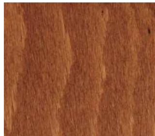
Tinto ciliegio PC3-110 Dark cherry PC3-110