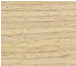
Rovere naturale Natural oak