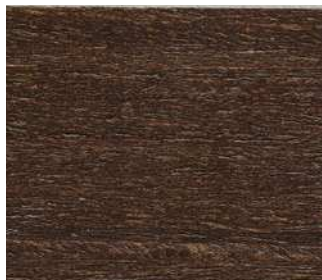
Rovere wengé Wenge-stain oak