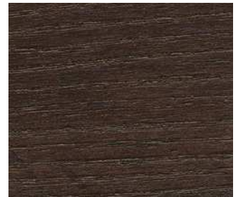
Frassino wengé Wengé ash