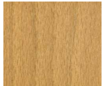
Faggio tinto noce PC3076 Walnut stained beech PC3076