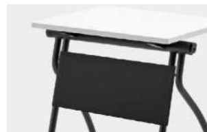
modesty panel pannello frontale