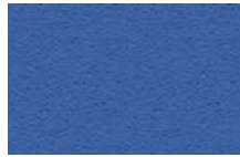
Blu - Blue RAL5015