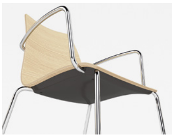
PSSTL Sottosedile in plastica Plastic underseat