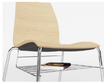
CSTL Cestino Rack