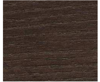
Frassino wengé Wengé ash