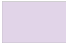
Lilla - Lilac P263