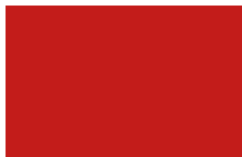
Rosso - Red RAL3020