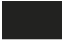
Nero - Black