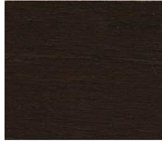
Faggio wengé Wenge-stain beech