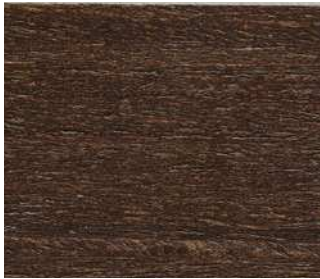
Rovere wengé Wenge-stain oak