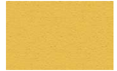
Giallo - Yellow RAL1023