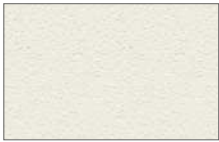
Bianco - White RAL9003