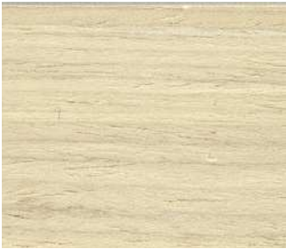
Rovere sbiancato Whitened oak