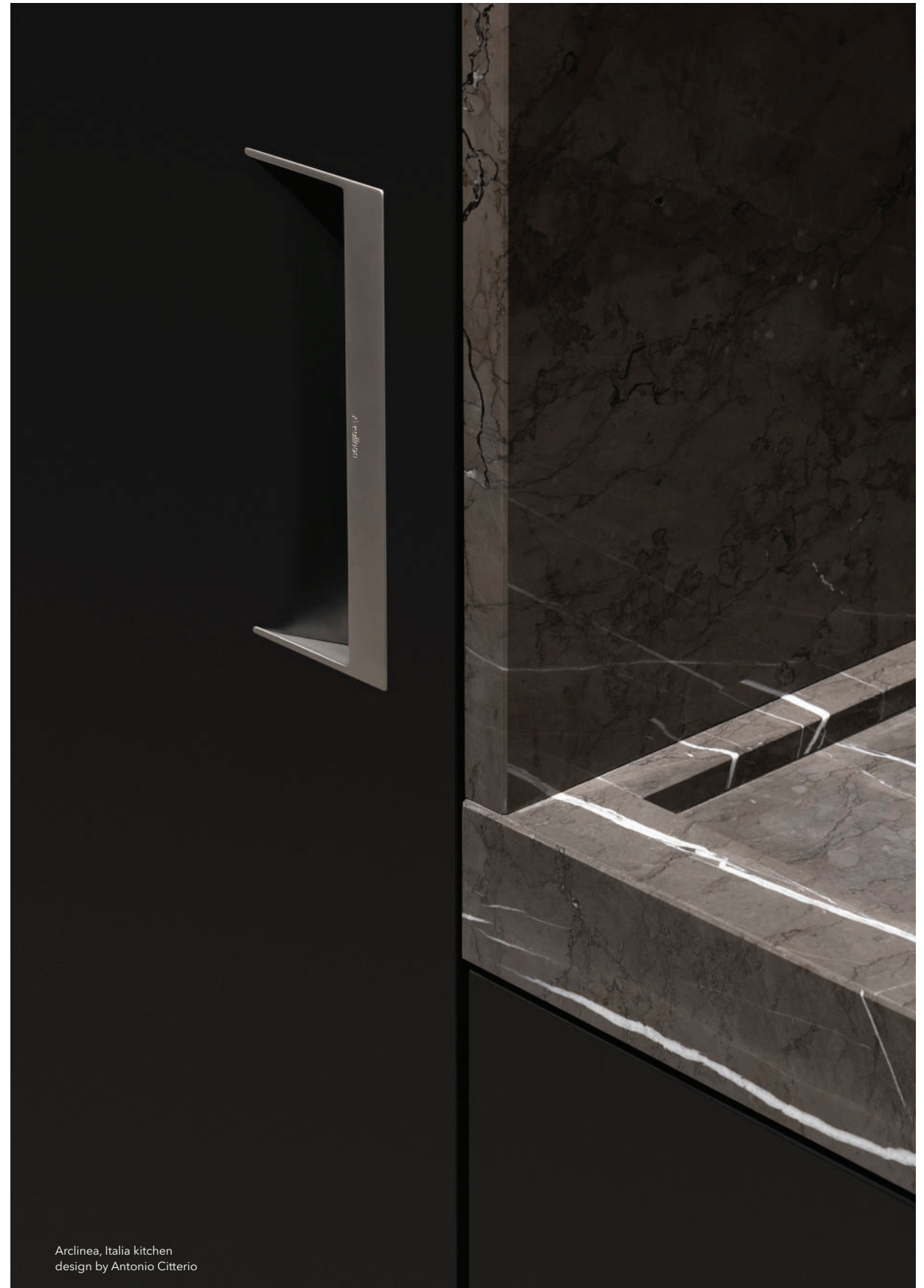
Arclinea, Italia kitchen design by Antonio Citterio

Geschichten aus verschiedenen Teilen der Welt sind die Inspiration für die zeitlose Palette von FENIX. In drei verschiedenen Produktlinien sind die Oberflächen für die Einrichtung und Innenausstattung mit vertikalen und horizontalen Anwendungen geeignet.