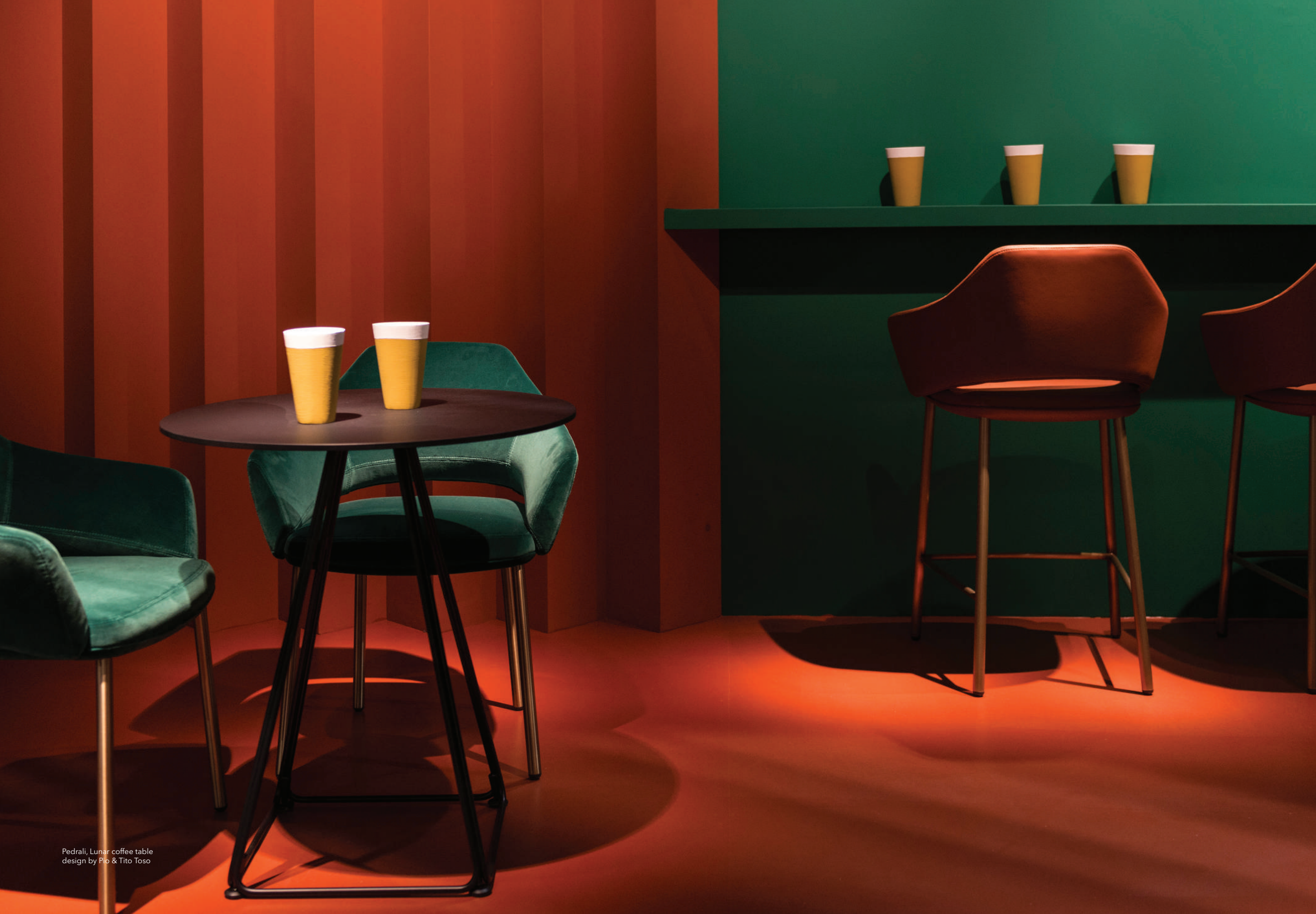
Pedrali, Lunar coffee table design by Pio & Tito Toso