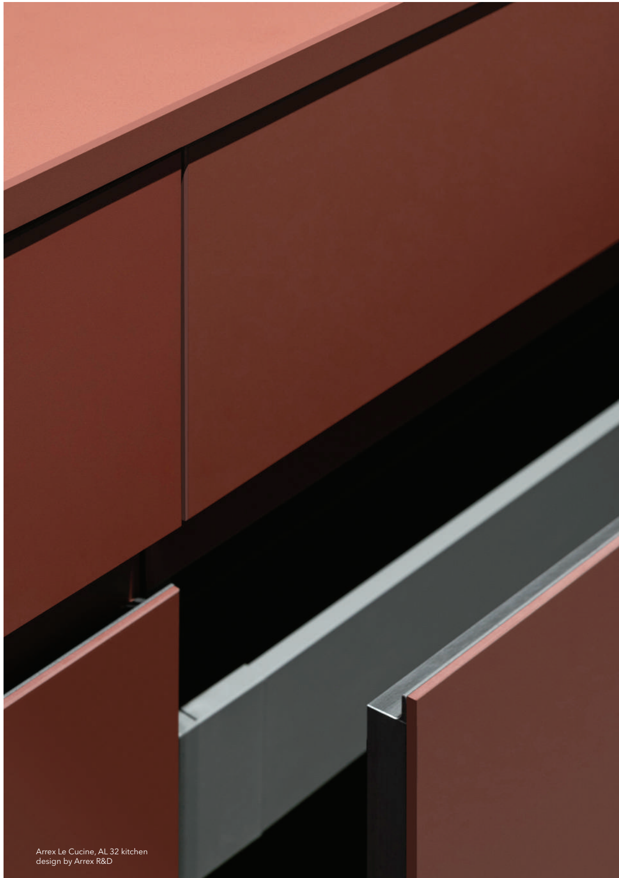
Arrex Le Cucine, AL 32 kitchen design by Arrex R&D