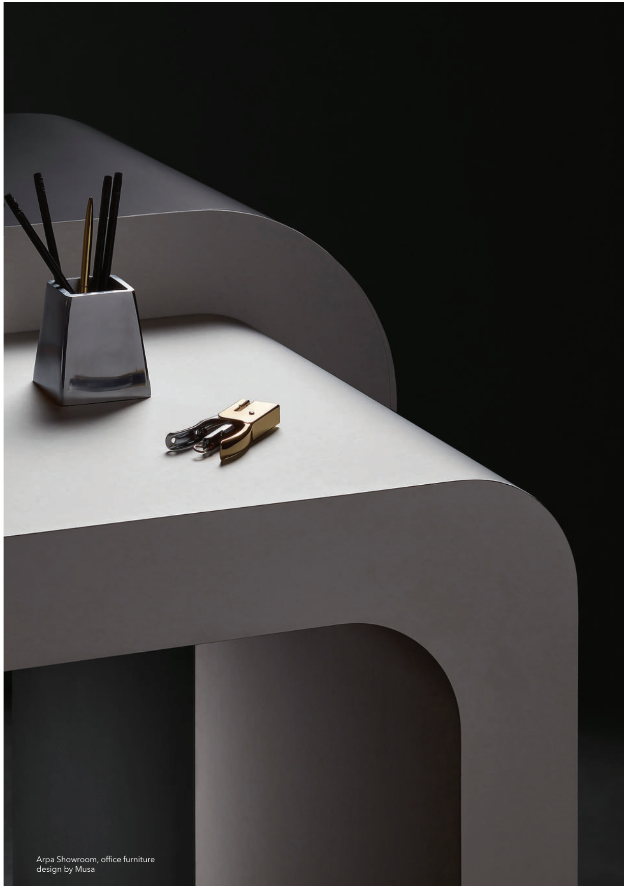
Arpa Showroom, office furniture design by Musa