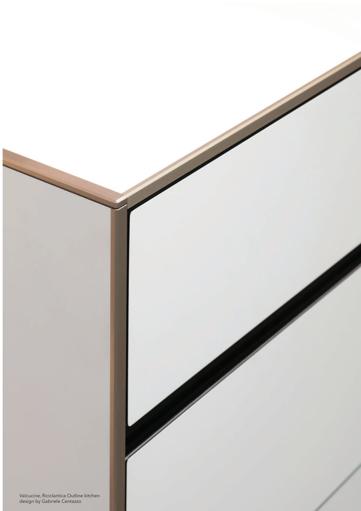
Valcucine, Riciclantica Outline kitchen design by Gabriele Centazzo