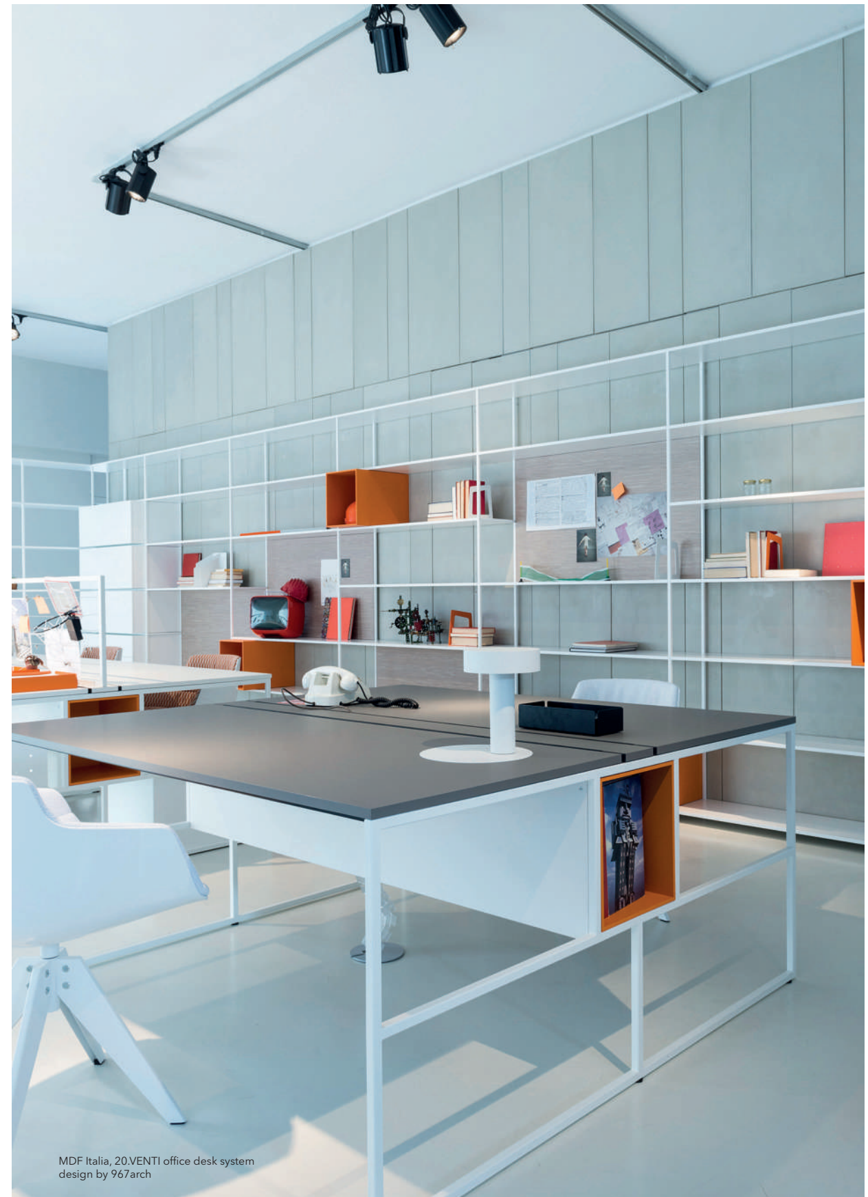
MDF Italia, 20.VENTI office desk system design by 967arch

All intellectual property rights and other rights regarding the content of this document (including logos, text and photographs) are owned by us and/or our licensors. FENIX, FENIX NTM, FENIX NTM Bloom and FENIX NTA are registered trademarks of Arpa Industriale.