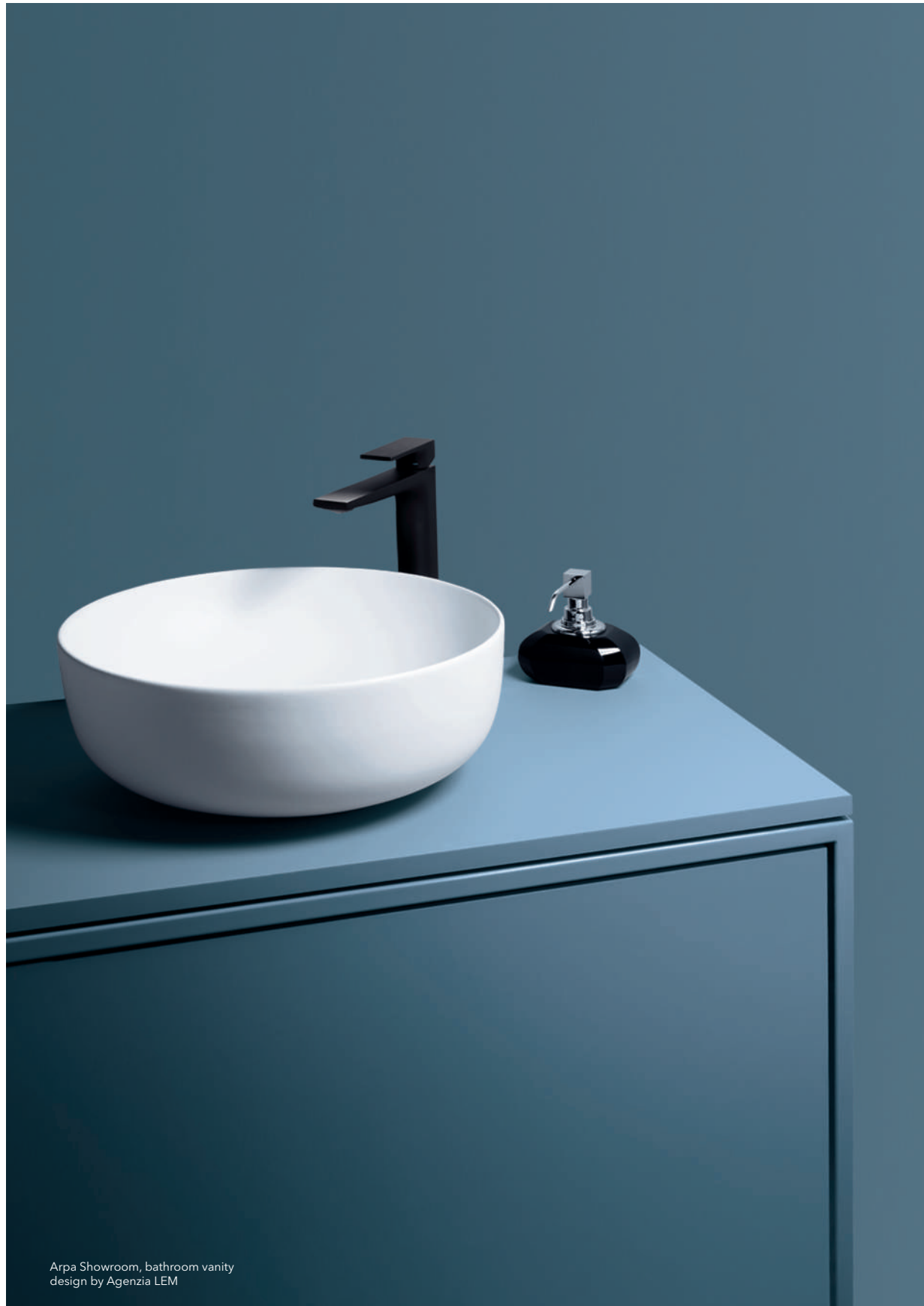
Arpa Showroom, bathroom vanity design by Agenzia LEM