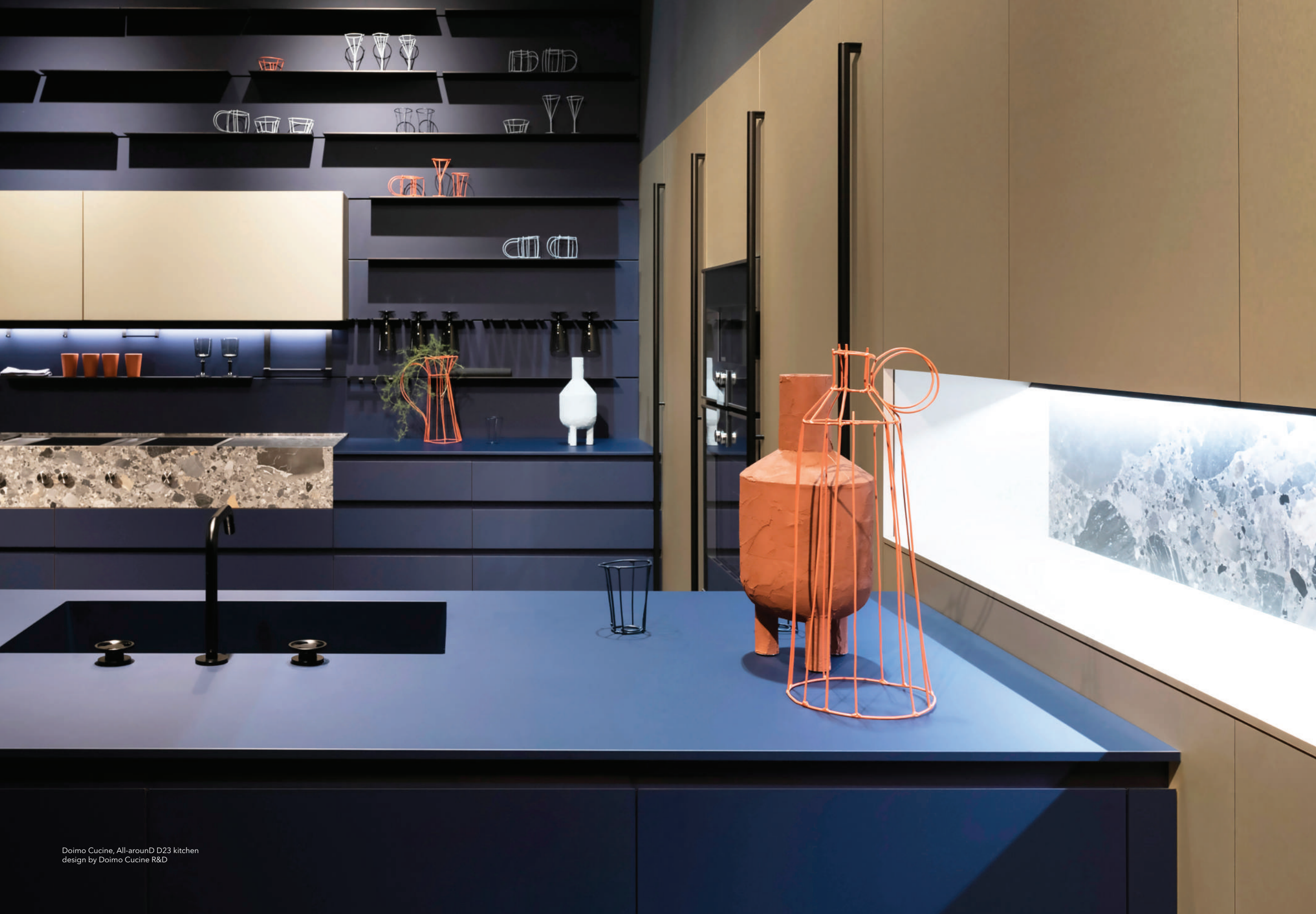
Doimo Cucine, All-around D23 kitchen design by Doimo Cucine R&D