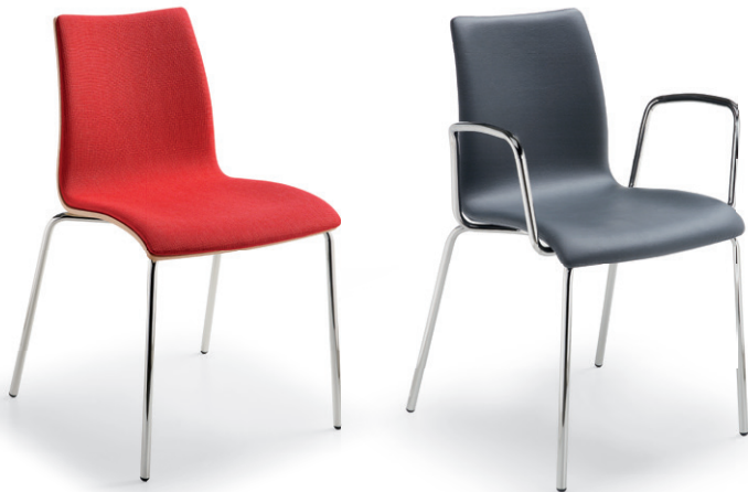
Imbottita / Upholstered