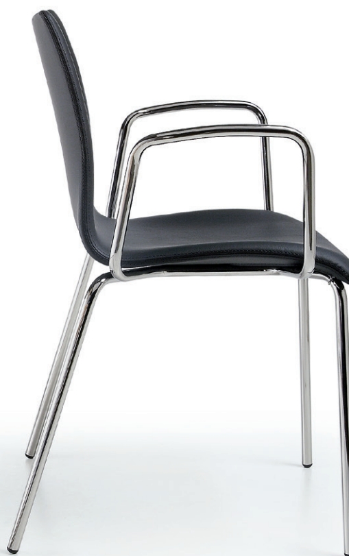
P290 imbottita upholstered