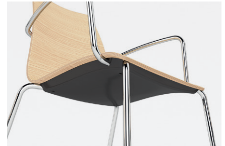
Sottosedile in plastica Plastic underseat