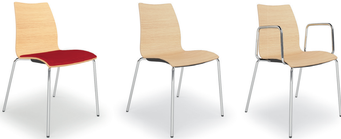
Faggio / Beech